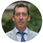
Fabrice RIGOLET-ROZE Préfet des Pays de la Loire Préfet de la Loire-Atlantique